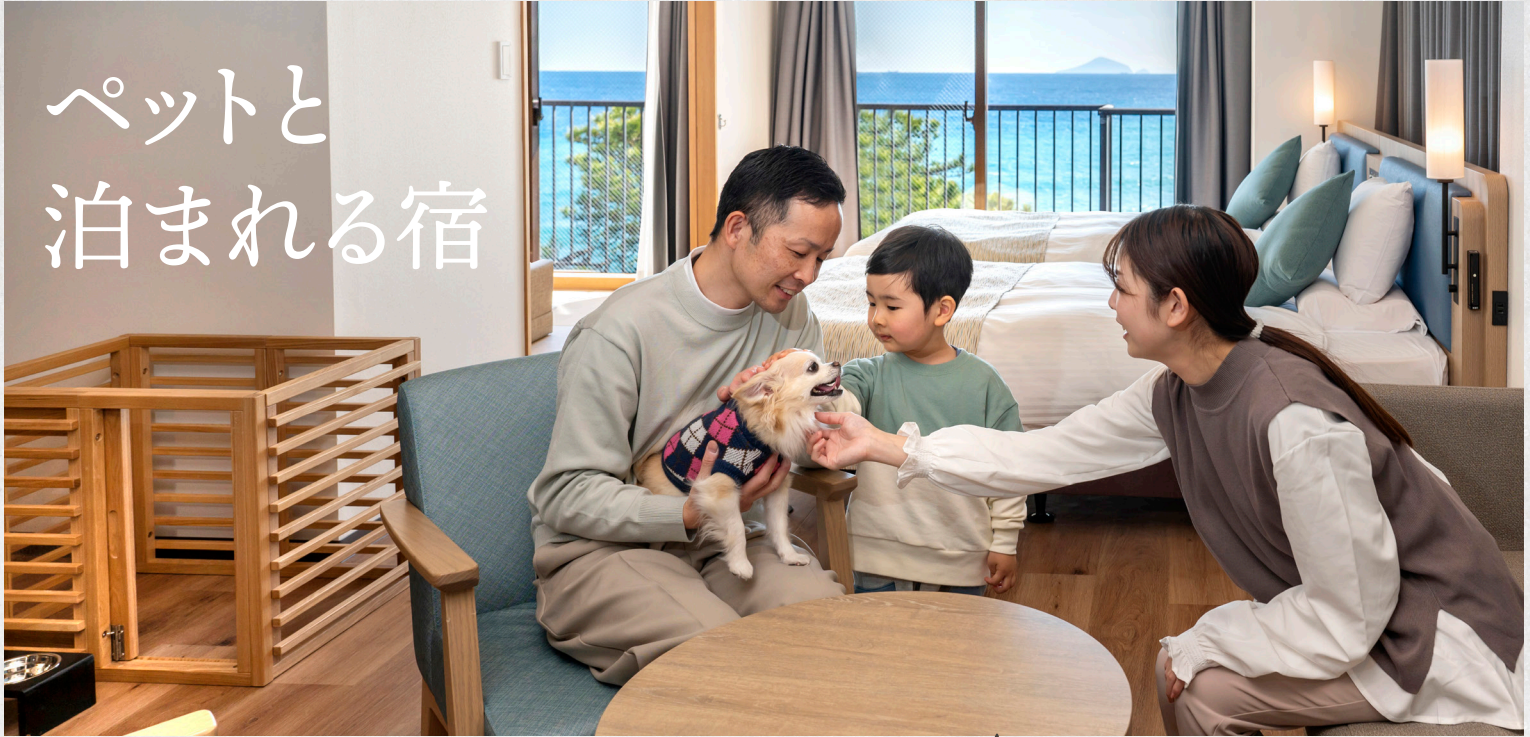
ペトルーム(ビューバスツイン)