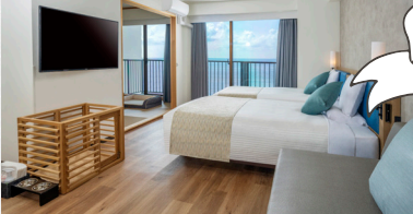
ペトルーム(和洋室)

ワンちゃん用グッズを揃えたお部屋でワンちゃんと一緒に過ごいただけます。最大、大人6名様までご宿泊いただけます。